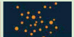
Ilość bakterii po 24 godzinach