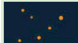
Ilość bakterii po 2 godzinach